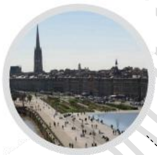
Bordeaux La Lycéenne Quai de Bordeaux