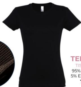
TEE-SHIRT TISSU PIQUE 95% POLYESTER 5% ELASTHANNE 13€ ttc