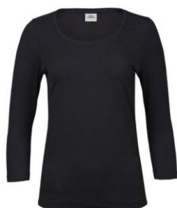
SOUS-PULL MANCHES 3/4 90% COTON 10% ELASTHANNE 15€ ttc