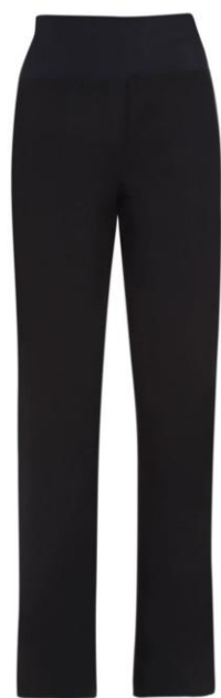
PANTALON POUVOIR TISSU PIQUE 95% POLYESTER 5% ELASTHANNE 25€ ttc