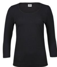
SOUS-PULL MANCHES 3/4 90% COTON 10% ELASTHANNE 15€ ttc