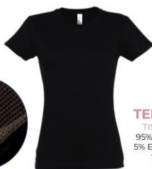
TEE-SHIRT TISSU PIQUE 95% POLYESTER 5% ELASTHANNE 13€ ttc